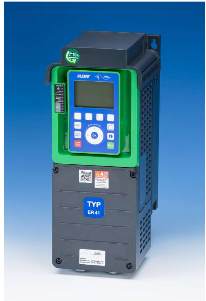
Version K in Schutzart IP21

Frequenzumrichter zur Drehzahlverstellung von DS-Asynchronmotoren und Synchronmotoren 0,75 bis 800,0 kW 380 bis 480 V, 3~ Schutzart IP21 bis IP55