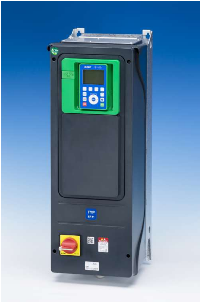
Version G-V2 in Schutzart IP55 mit Lasttrennschalter